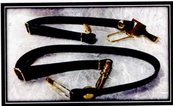
สายกระบี่หนังสีดำ ใช้ประกอบเครื่องแบบปกติขาว เครื่องแบบปกติกาเกีคอบแยะ

สายกระบี่สำหรับนายทหารสัญญาบัตร(เดิม) เป็นไปตามกฎกระทรวง (พ.ศ.๒๕๒๓) ออกตามความในพระราชบัญญัติเครื่องแบบทหาร พ.ศ.๒๕๓๗ ว่าด้วยเครื่องแบบทหารเรือ ฉบับที่ ๑๙ ข้อ ๑๑ ให้ยกเลิกความในข้อ ๑๘ แห่งกฎกระทรวง (พ.ศ.๒๕๑๘) ออกตามความในพระราชบัญญัติเครื่องแบบทหาร พุทธศักราช ๒๕๓๗ ว่าด้วยเครื่องแบบทหารเรือ ฉบับที่ ๑๖ และให้ใช้ความต่อไปนี้แทน “ข้อ ๑๘ สายกระบี่ ทำด้วยหนังสีดำ เป็น ๒ สายกว้างสายละ ๑.๕ เซนติเมตร ตอนบนมีขอสำหรับแขวนกับเข็มขัด ตอนล่างมีขอชนิดแทนบสำหรับเกี่ยวกับกระบี่ สำหรับนายทหารสัญญาบัตร เมื่อแต่งเครื่องแบบครึ่งยศ เครื่องแบบครึ่งยศรักษาพระองค์ เครื่องแบบเต็มยศ และเครื่องแบบเต็มยศรักษาพระองค์ ทำด้วยสั๊กหลาด กว้าง ๑.๕ เซนติเมตร มีแถบไหมทองหรือวัสดุเทียมทอง กว้าง ๑.๒ เซนติเมตร ตรงตรงกลางตามยาวด้านนอก” สายกระบี่สำหรับนายทหารสัญญาบัตรประกอบด้วยสายกระบี่ ๒ แบบ คือ ๑) สายกระบี่หนังสีดำ ใช้ประกอบเครื่องแบบปกติขาว เครื่องแบบปกติกาเกีคอบแยะ และ ๒) สายกระบี่แถบไหมทองหรือวัสดุเทียมทอง ใช้ประกอบเครื่องแบบครึ่งยศ เครื่องแบบครึ่งยศรักษาพระองค์ เครื่องแบบเต็มยศ และเครื่องแบบเต็มยศรักษาพระองค์ ดังนั้นจึงทำให้เกิดความสับสนและขาดความคล่องตัวในการปฏิบัติงาน โดยนายทหารสัญญาบัตรจะได้รับแจกจ่ายสายกระบี่ทั้ง ๒ แบบ ซึ่งเมื่อมีการปรับปรุงสายกระบี่เป็นแถบไหมทองหรือวัสดุเทียมทองเพียงชนิดเดียว จะไม่ส่งผลกระทบต่อการใช้ปฏิบัติของกำลังพล และทำให้ประหยัดงบประมาณลงจากเดิม